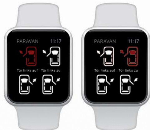
Application sur Apple Watch