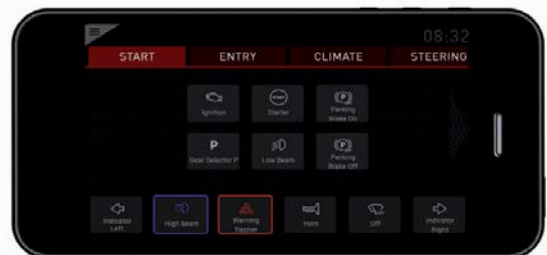
Application sur iPhone